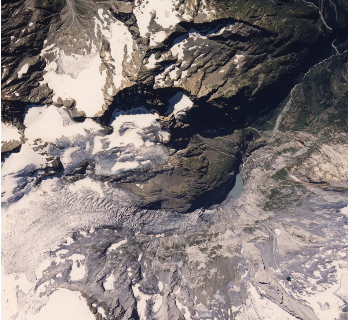
Abbildung 1: Luftbildaufnahme des Hangfirns am 24. August 2000.