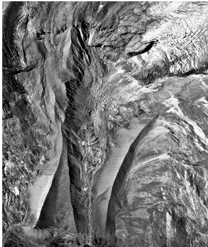
Abbildung 1: Zungenrutschung am Hohlalpgletscher vom Sommer 2003. Luftbilder vom 13. August (oben) und vom 16. September 2003 (rechts, Aufnahmen V+D).