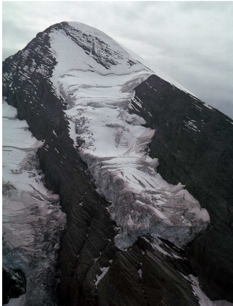
Abbildung 1: Hängegletscher am Rinderhorn (Foto H. Röthlisberger, 20. September 1979).